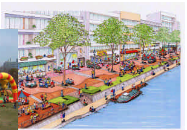
京橋川オープンカフェ利用イメージ