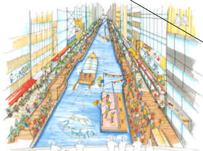
戎橋からみた空間利用イメージ (イベント時)