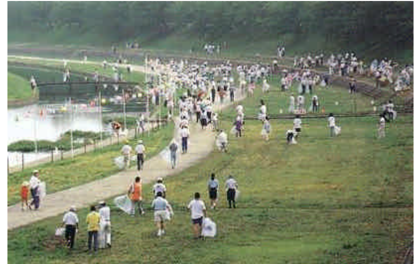
市民団体等と連携した河川清掃状況 (旭川 (岡山県))