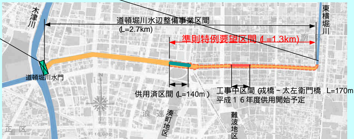
道頓堀川水辺整備事業