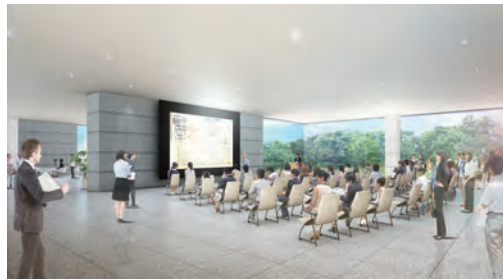
エントランスホールから来館者スペースを眺める(イメージ)

■来館者用スペース(1) 100名程度を想定したレセプションやイベントが開催できるよう十分なスペースを確保する。 各種イベントに対応できるようAV機器設備を計画する。