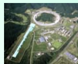
SPring-8、X線自由電子レーザー