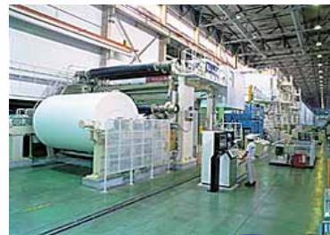
紙・パルプ 出荷額 日本一