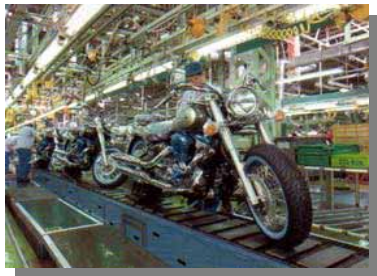
二輪自動車 生産台数 日本一