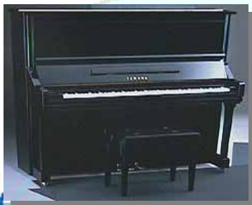
ピアノ 出荷額 日本一