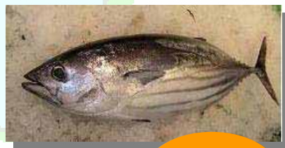
かつお 漁獲量 日本一