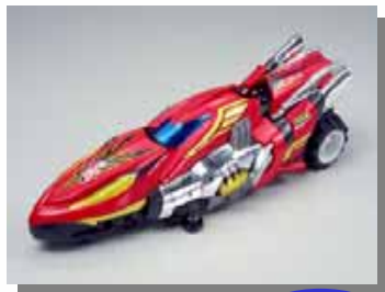
プラモデル 出荷額 日本一