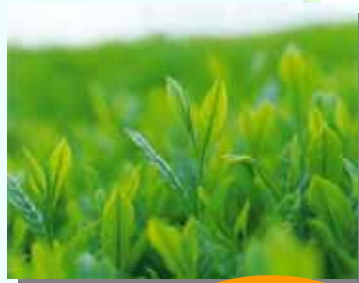
お茶 収穫量 日本一