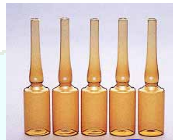
医薬品・医療機器 生産額 全国2位