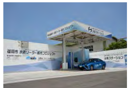
福岡市中部水処理センター内 下水汚泥消化ガス水素ステーション