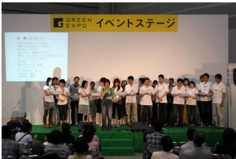
イベントステージ 白井貴子さんライブ