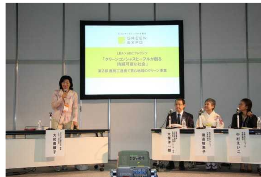
農商工連携ビジネスセミナー