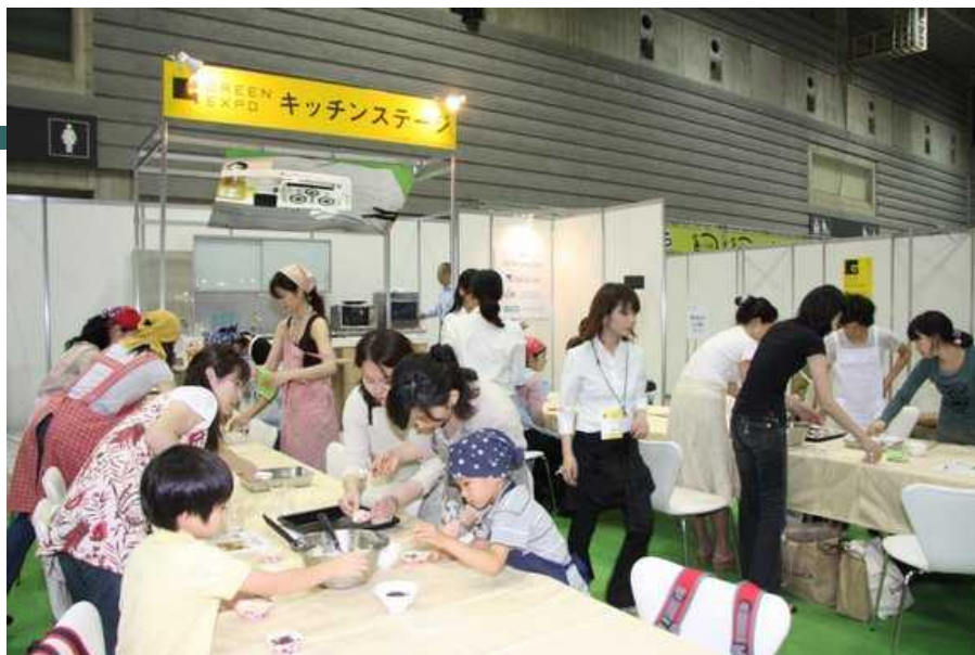
キッチンステージ