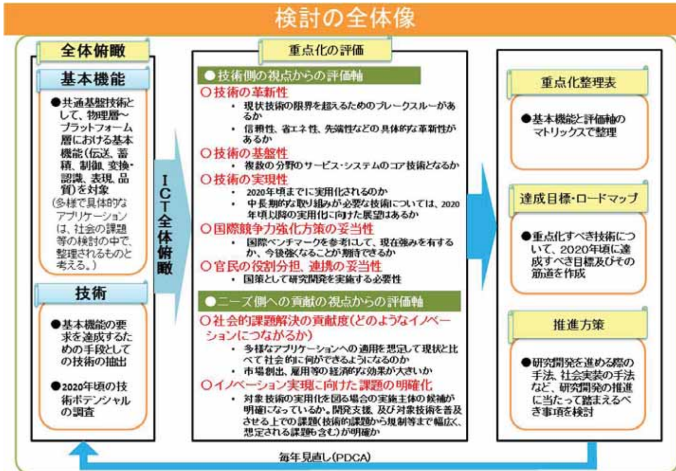
図 2-1 : ICT の検討の全体像