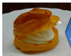
レアチーズシュークリーム