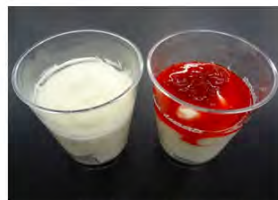
レアチーズムース