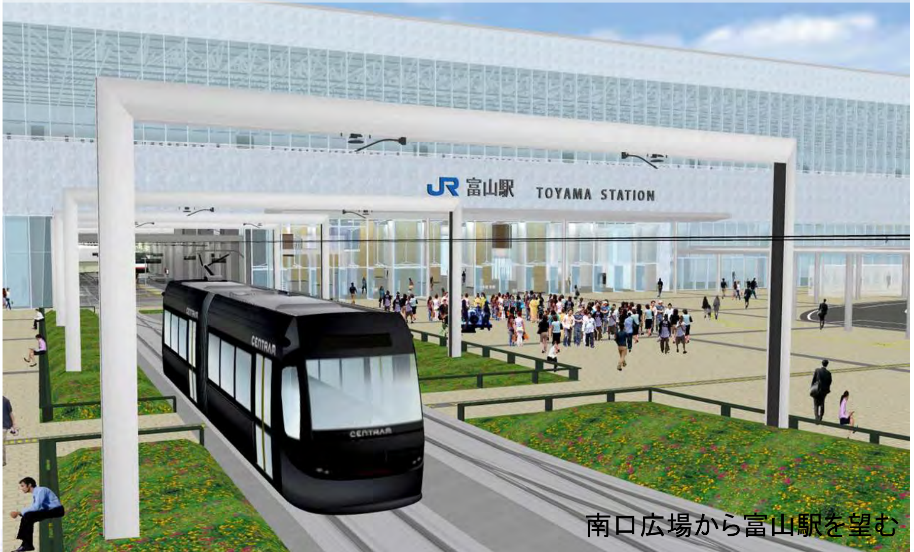
南口広場から富山駅を望む