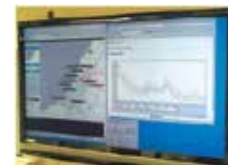
モニタリング情報共有システム