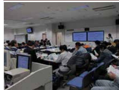
原子力防災訓練の模様