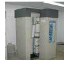
ホールボディカウンター