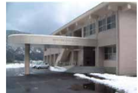
オフサイトセンターの外観