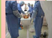
原子力災害医療体制の整備