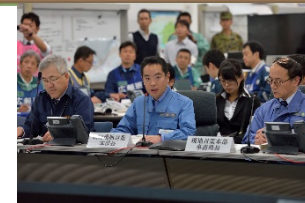
原子力総合防災訓練の模様