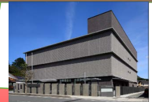
オフサイトセンターの外観