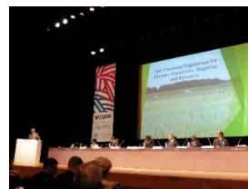
国際会議の様子(イメージ)