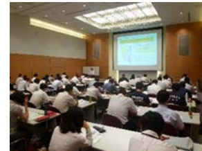
研修の様子(イメージ)