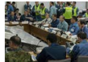
訓練の様子(イメージ)