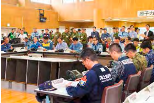
合同対策協議会 全体会議の様子