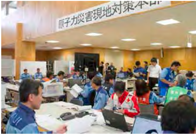
福井県原子力災害現地対策本部