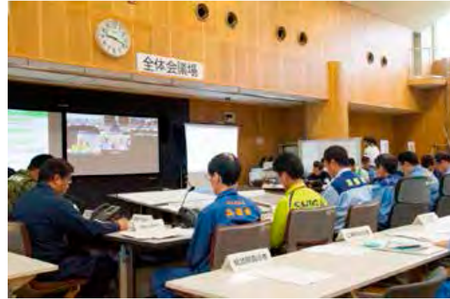
合同対策協議会 全体会議(TV会議を活用)