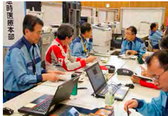
各機能班における情報共有