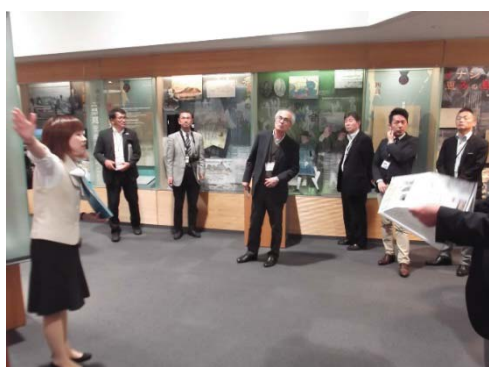
北海道立北方四島交流センター（ニ・ホ・ロ）