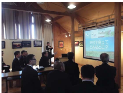
野付半島ネイチャーセンター