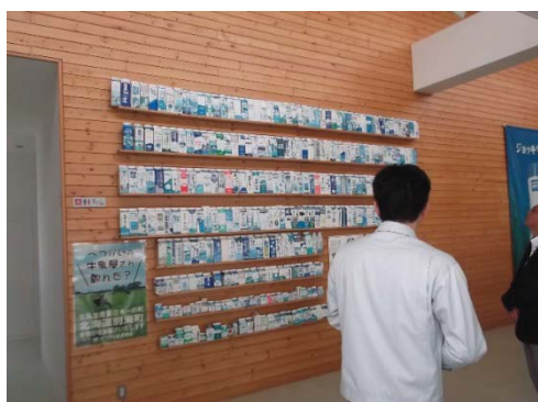
べつかい乳業興社