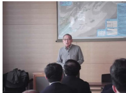
羅臼国後展望塔 (語り部による講話)