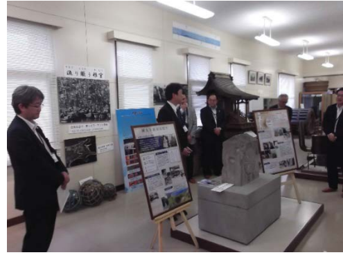
根室市歴史と自然の資料館