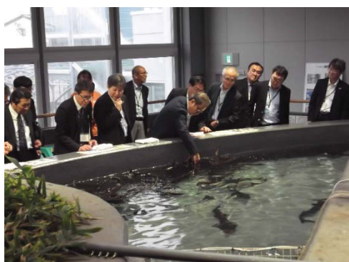
標津サーモン科学館