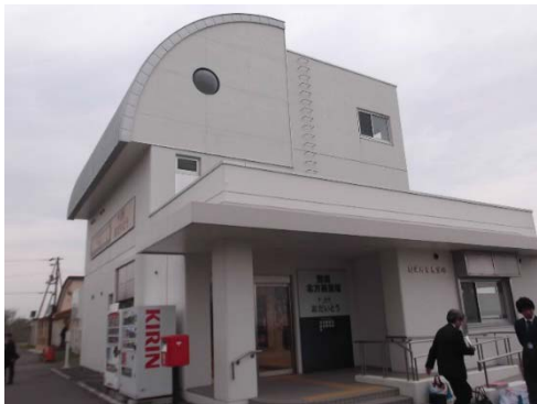
道の駅おだいとう