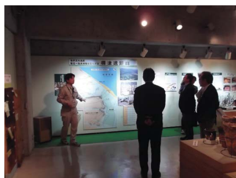
ポー川史跡自然公園