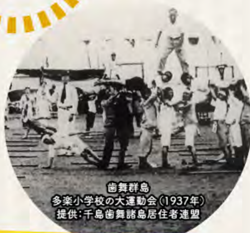
歯舞群島 多楽小学校の大運動会(1937年)