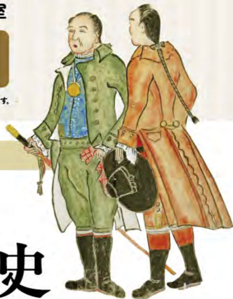
「大黒屋光太夫と磯吉」 桂川甫周(国瑞)「吹上秘書深沢御覽之記」

*新型コロナウイルス感染症対策を徹底するため、手指消毒や検温等にご理解とご協力をお願いいたします。