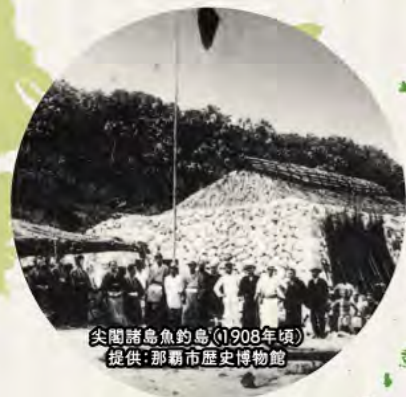
尖閣諸島魚釣島(1908年頃)