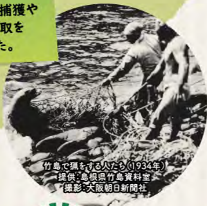
竹島で獺をする人々(1934年)