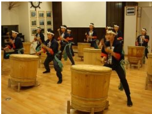
知床いぶき樽鑑賞