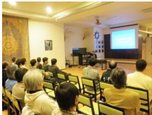
羅臼の自然についての講話