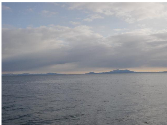
漁港より国後島を望む