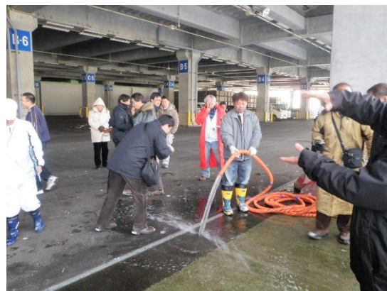
海洋深層水について