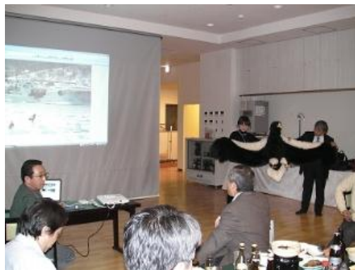
羅臼に関わる講話