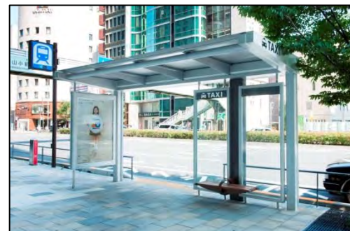
青山OMスクエア前 タクシー乗り場