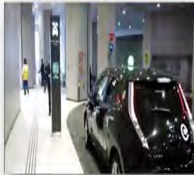
東京スカイツリータウン内EV/HVタクシー乗り場