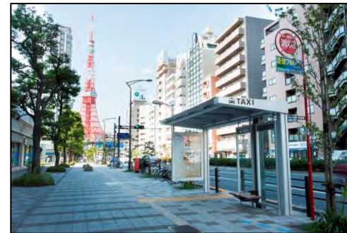
三田国際ビル タクシー乗り場