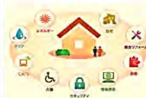
<暮らしの総合サービス>