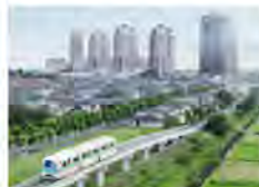
<自社で鉄道を運行>