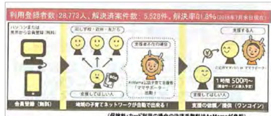
<「子育てシェア」のシステム>