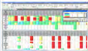
<利用者数の「見える化」>