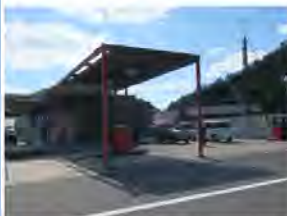
<小売店とガソリンスタンド>