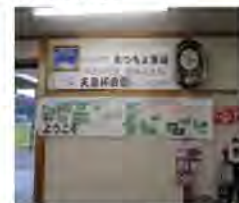
<平成16年度農林水産杯村作り部門天皇杯を受賞>