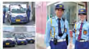
<民間交番による巡回>