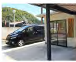
<デマンドタクシー>