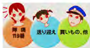
<生活救援タクシー(Qタク)>