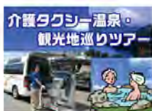
<観光タクシー(ふらタク)>