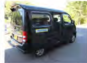
<地域内交通たすけ愛号>