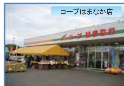
コープはまなか店