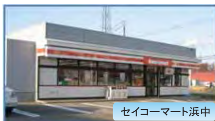
セイコーマート浜中