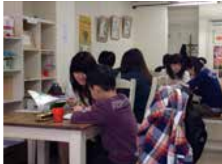
【へるすたでい拠点】