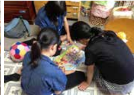
【ねっこぼっこ拠点】