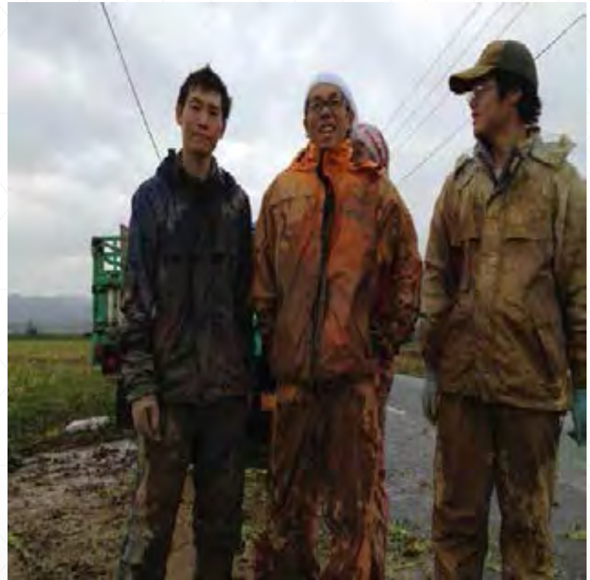
利用者達が農業で汗を流す姿