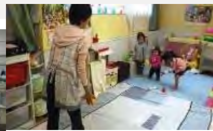
(託児サービスの様子)

・平成26年度実績（速報値）：受講者数合計：55,005人 うち女性：39,249人（71.4%） ・30代女性に占めるひとり親の割合：23.1% ※JILPT制度利用者調査 40代女性に占めるひとり親の割合：26.1% ※JILPT制度利用者調査