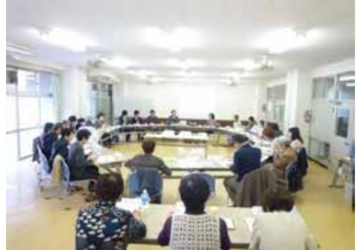
高島平団地で暮らし続ける仕組みをつくる会の様子