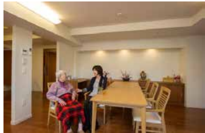
新しい仕組み：有料ショートステイ