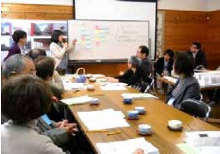
設計勉強会。コンセプトや間取りの特徴を学ぶ