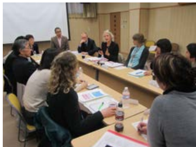
招へい：鳥取県における施設訪問 社会福祉法人敬仁会 地域ケアセンターマグノリア