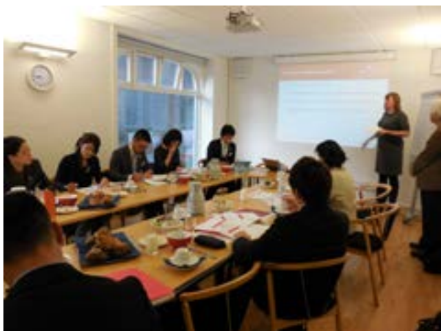
派遣：デンマーク 社会庁にて、デンマークの福祉制度についての講義

様々な学習活動の成果が適切に評価される社会の実現に向け、各個人の学習成果を測る検定