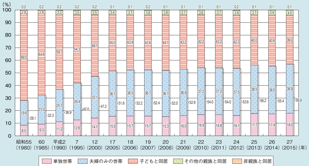
図1-2-2 家族形態別にみた65歳以上の高齢者の割合

・65歳以上の高齢者について子供との同居率をみると、昭和55（1980）年にはほぼ7割であったものが、平成27（2015）年には39.0%となっており、子と同居の割合は大幅に減少している。単独世帯又は夫婦のみの者については、昭和55（1980）年には合わせて3割弱であったものが、平成27（2015）年には56.9%まで増加している（図1-2-2）。