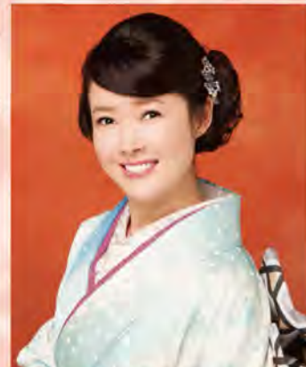
パネリスト: 田川 寿美 (歌手)