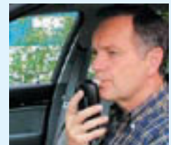
資料提供：日本自動車研究所

また、内閣府では、上記の調査と平行して、飲酒運転をした場合の保険支払のあり方等飲酒運転の根絶に資する自動車保険のあり方について検討を行うこととしている。