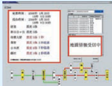
鉄道交通における利活用の様子