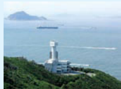
伊勢湾海上交通センター