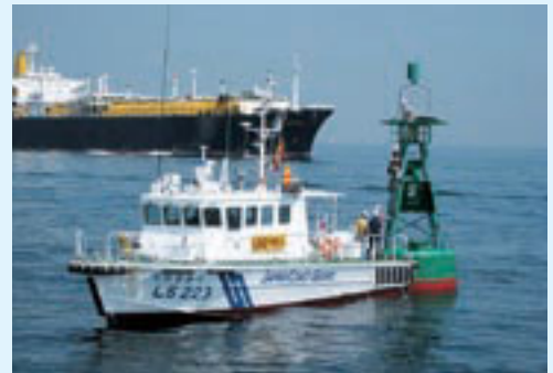
浦賀水道航路第五号灯浮標設置状況

引き続き、海上保安庁では船舶運航者等に対し海上交通法令の周知徹底、安全運航の励行を指導するとともに、関係機関等と協力し船舶運航者等に限らず広く国民に対し海難防止思想を広め、海難の未然防止に取り組むこととしている。