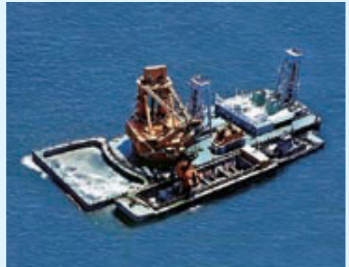
中山水道・浚渫状況