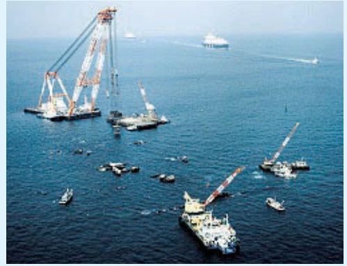
第三海堡・撤去状況

海上保安庁ではこれら新たな海上交通環境に対応した海上交通規制等への見直しを行うため、平成19年10月に海上交通安全法に基づく交通政策審議会を開催し、同審議会で得られた答申を踏まえ「海上交通安全法施行規則」の改正等を行い、同20年1月1日から施行した。