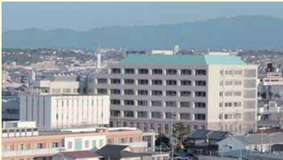
泉大津市立病院の外観

この結果、昭和59年2月に千葉療護センターを開設して以来平成25年3月末までに、入院患者数は1,070名となり、その約25%に相当する271名の者が脱却 2 を果たしたほか、脱却に至らない者の場合にも重症度に応じた治療改善効果が認められている。