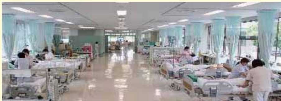
ワンフロア病棟システム