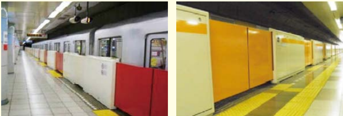
【ホームドアの整備例】

○視覚障害者等を始めとしたすべての駅利用者のホームからの転落を防止するための設備としてホームドア（可動式ホーム柵含む。）は非常に効果が高く、その整備を推進している。（平成27年9月末現在で621駅に設置）