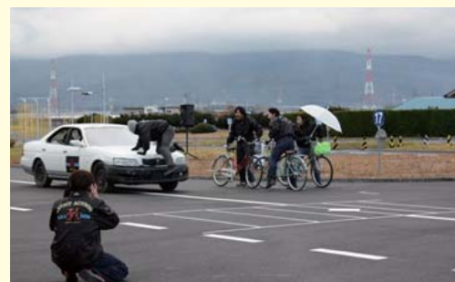
スケアードストレイト