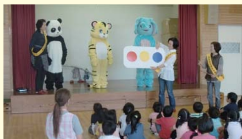
幼稚園児に対する交通安全教室