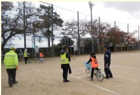
小学4年生以上を対象とした自転車教室