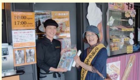
飲食店に対する交通安全啓発活動

南相馬市では、平成28年7月12日に一部の帰還困難区域を除く避難指示区域が解除された。今後は、南相馬市交通安全母の会の活動の再開を目指し、鹿島区交通安全母の会は、より一層、交通安全・交通事故防止活動を推進していく。