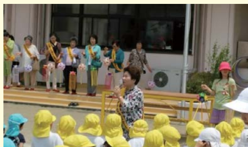
石巻市内の子供たちを対象に交通安全について説明