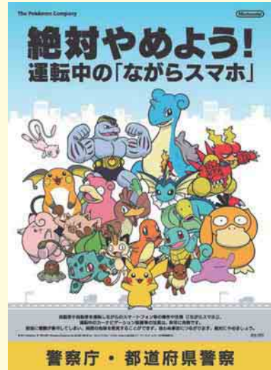
広報啓発用ポスター

合わせて、ゲーム業界団体に対しては、安全対策等に関する取組の呼びかけ、自動車運送関係の業界団体に対しては、乗務中の携帯電話等の使用禁止について文書により徹底するとともに、運転者が乗務中に携帯電話を使用したことが判明した場合には、運送事業者に対し、監査及び処分等を厳格に実施するなど、関係府省庁一体となり、地方公共団体、関係機関、団体等と連携して対策を総合的に推進していくこととしている。