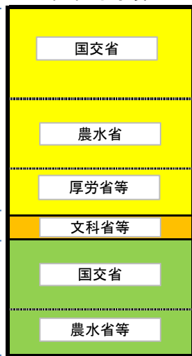
(前年度繰越分を含む)