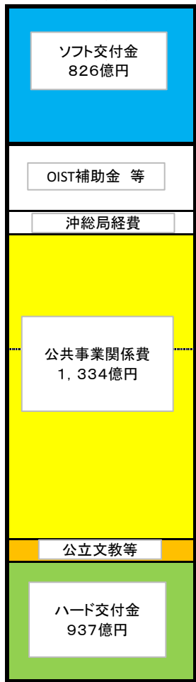
(一般会計+復興特会ベース)

当初予算 3,501億円 補正後 3,520億円 前年度繰越 1,152億円 計 4,671億円 (歳出予算現額)