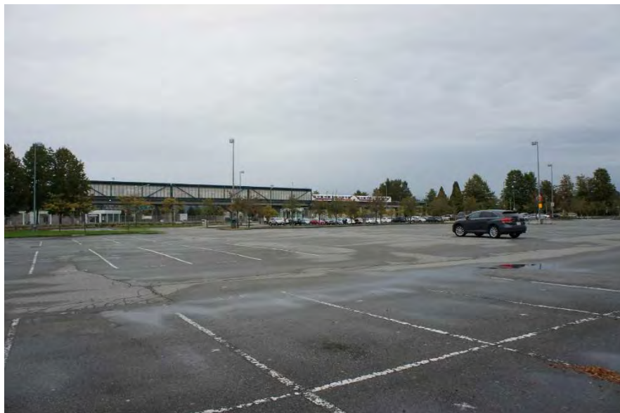
図 1,471 台収容可能なパーク&ライド駐車場 (Scott Road 駅)