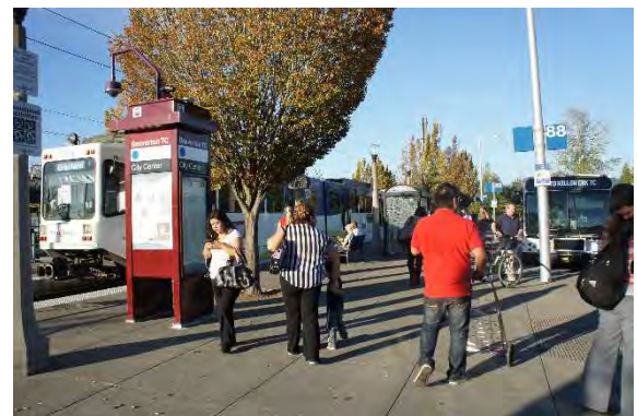
図 左：トランジットセンター、右：LRTとバスの対面式乗換 (Beaverton Transit Center 駅)