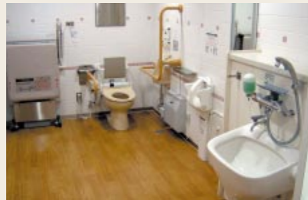
中央合同庁舎3号館