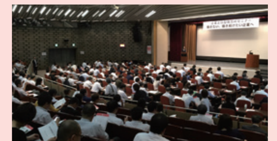
企業主導型保育事業に関するセミナー (大阪商工会議所主催/2016年9月16日 大阪商工会議所)