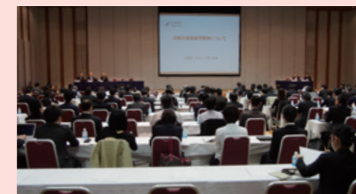
企業主導型保育事業の説明会 (経団連主催/2017年4月6日 経団連会館)

企業主導型保育事業は一般事業主からの拠出金により運用されております。日本経済団体連合会、日本商工会議所等と連携して推進しております。