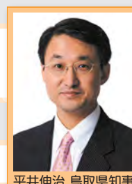
平井伸治 鳥取県知事