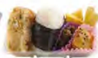
小高商業高校発! 復興にぎり飯セット