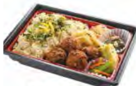
気仙沼西高発! Come Come 弁当

高校生の授業の一環で地元の食材を使った商品を高校生から提案してもらい、商品を開発&販売。東北エリアでは、開発商品の売上の一部を「夢を応援基金」に寄付して被災地の復興を応援します。