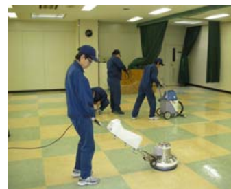
特別支援学校生徒への社会知識習得のお手伝い