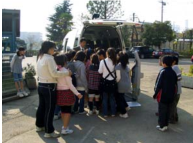
市福祉協議会と合同で総合学習体験