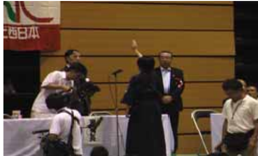
スポーツ大会などの協賛