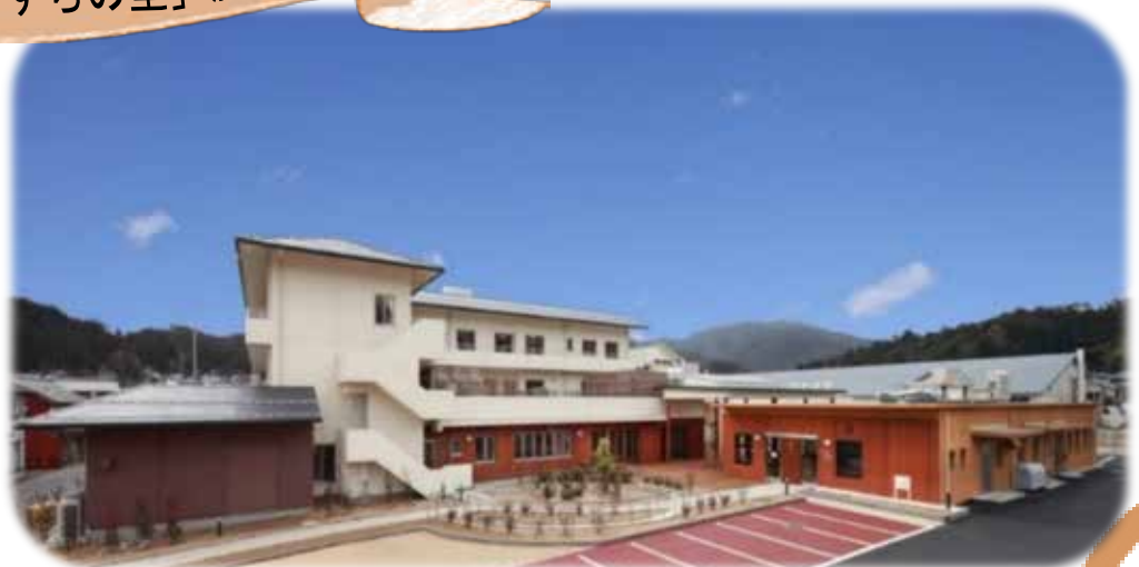
「やすらの里」施設外観