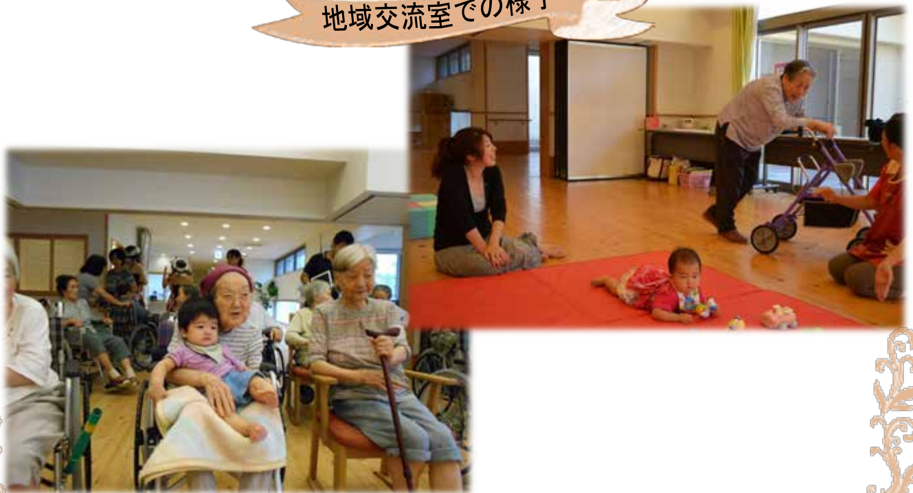
地域交流室での様子