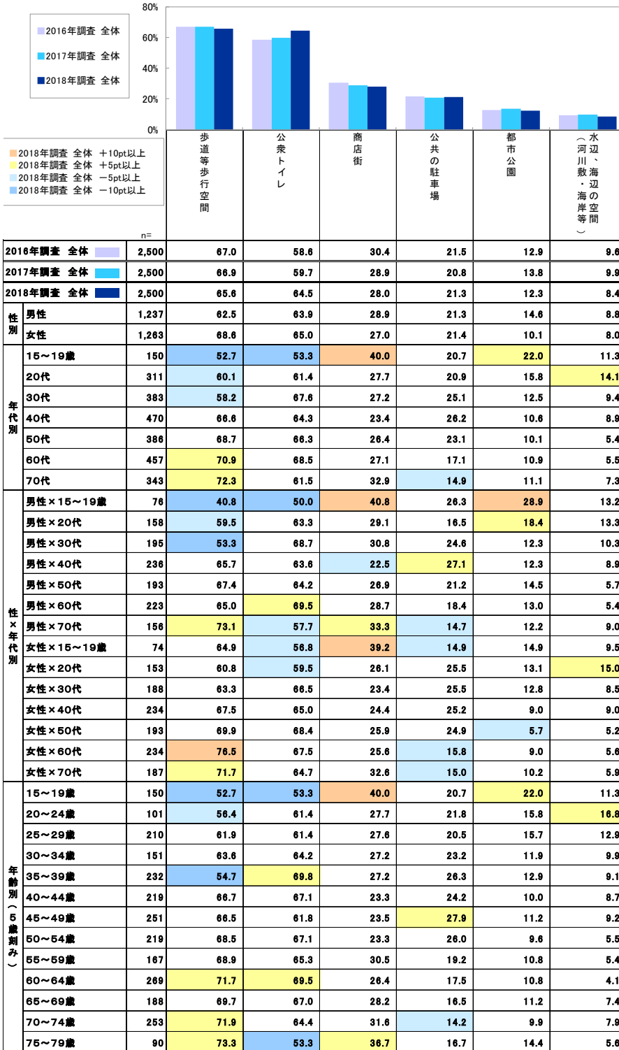
Q21.あなたは、それぞれの公共空間の利用者に対する情報提供等について、今後、特にどの公共空間を重点的にバリアフリー・ユニバーサルデザインとしていくことが必要だと思いますか。1～6の中からあてはまるものを2つ（必須）教えてください。