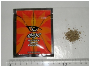
[Chill X (new version)]