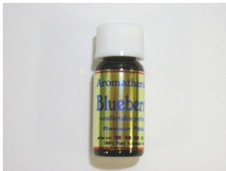
[Aromatherapy NEW Blueberry]