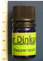
[Fair Dinkun Aromatherapy Peppermint]