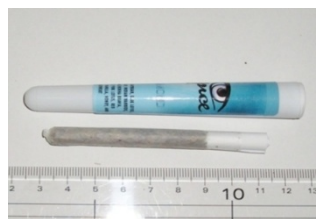
[Spice DIAMOND pipe]