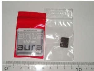
[aura afgan solid]

省令名: 2-(2-メキシフェニル)-1-(1-ペン チル-1H-インドール-3-イル)エタノ ール