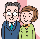
インターネットに関連した事業者