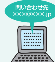
問い合わせ窓口の整備