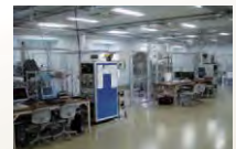
衛星帯電放電試験装置群