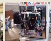
超小型衛星試験 (右: 熱サイクル試験)