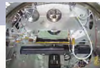
帯電放電試験装置に入れられた 太陽電池パネル供試体