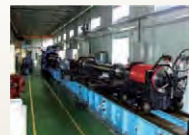
超高速衝突実験施設