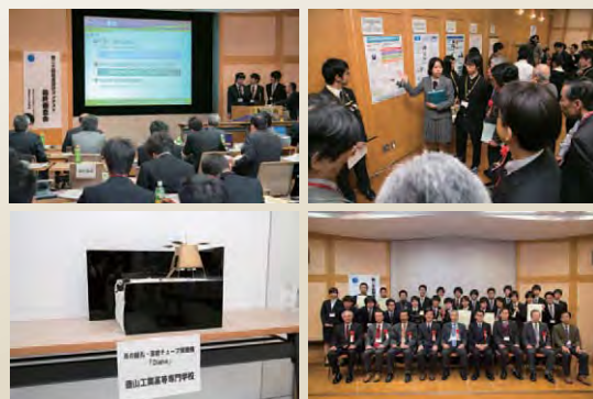
第20回衛星設計コンテスト 最終審査会の様子

近年では、本コンテストへの参加をSSH(スーパーサイエンス・ハイスクール)の活動の一環として取り入れている高校も存在する。「宇宙」を教育に取り入れ、また若年層への宇宙開発への興味を促進することに貢献している。特に、本コンテストには「ジュニアの部」があり、高校生らの宇宙利用のアイデアを大事にして、育て上げるプロセスを重視している。