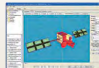
MUSCAT でモデル化された 「きずな」(WINDS)