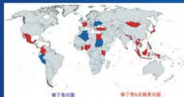
宇宙工学国際コース学生の出身国分布(2017年10月時点)

国連宇宙部と連携し、国際的に宇宙分野での人材育成に貢献した点を評価。宇宙技術が国際貢献の一つの重要なツールと認められたことの意義は大きい。