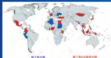
宇宙工学国際コース学生の出身国分布(2017年10月時点)

国連宇宙部と連携し、国際的に宇宙分野での人材育成に貢献した点を評価。宇宙技術が国際貢献の一つの重要なツールと認められたことの意義は大きい。