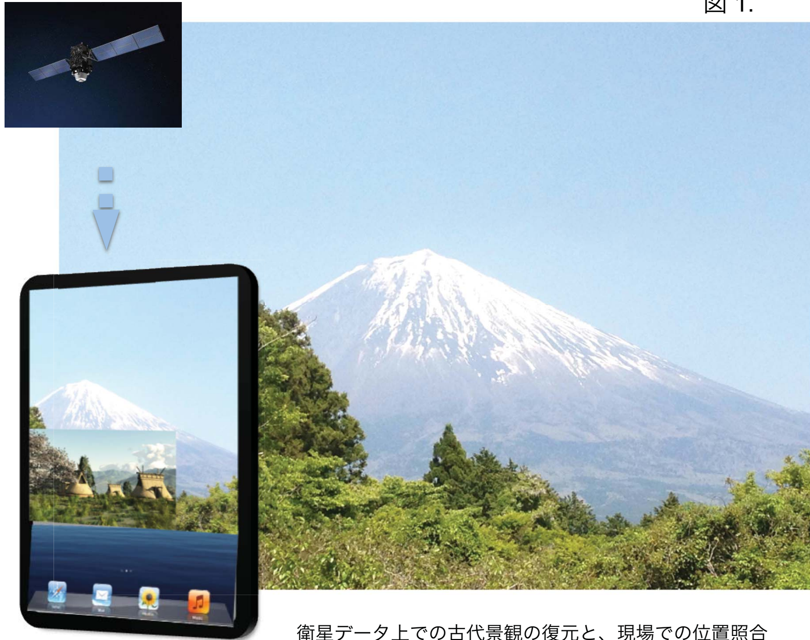
衛星データ上での古代景観の復元と、現場での位置照合