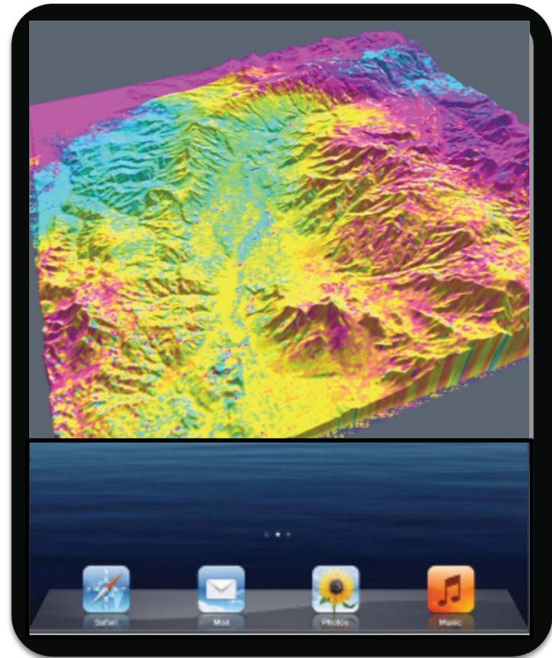
地すべり発生地点の照合