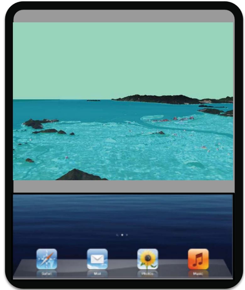
古代海岸線の現場での照合