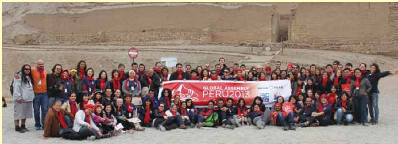
18か国から108名が参加 108 participants from 18 countries join the Global Assembly.