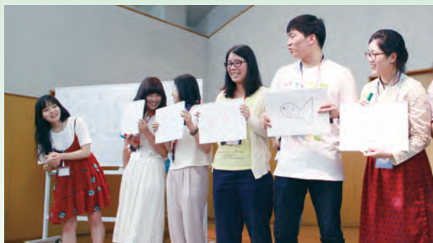
チーム対抗で絵描きしりとりを行う（アイスブレーキング）

7月24日～26日、韓国青年30名と日本青年30名が一堂に会し、日韓青年親善交流のつどいが行われた。アイスブレーキングやディスカッション、日韓文化体験等を通じ、両国の青年は友情を深めた。