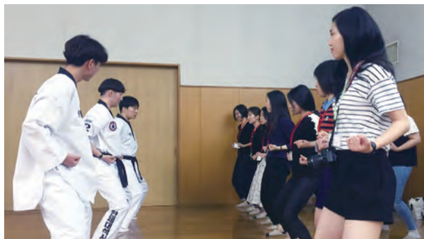
韓国青年からテコンドーの型を教わる（日韓文化体験祭り）