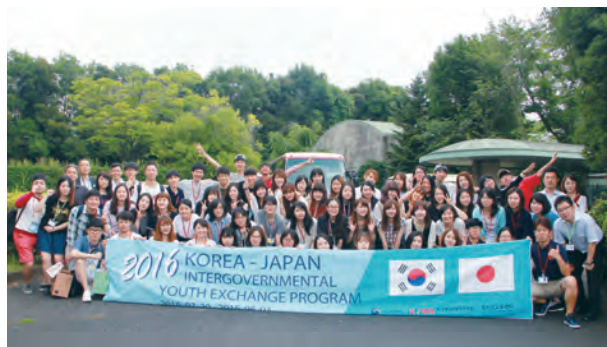
新たにつながった日韓の輪を感じながら、全員で記念撮影をする