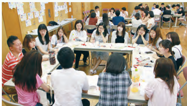
日韓青年が五つのテーマに分かれて討論する（ディスカッション）