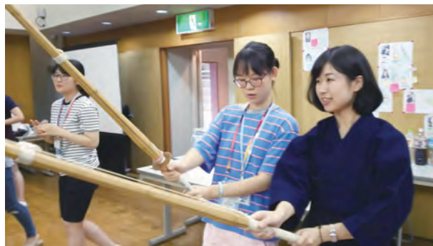
日本青年から竹刀を使って剣道を教わる（日韓文化体験祭り）