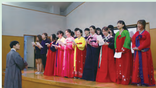
韓国青年がソウルオリンピックのテーマ曲「手に手を取って」を合唱する（日韓文化交流の夕べ）