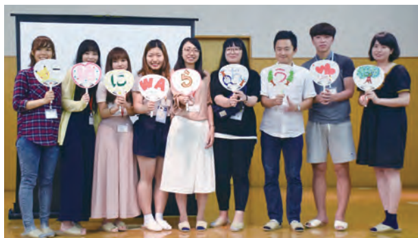
グループごとにオリジナルのメッセージを込めてうちわを作る（共同制作）